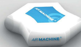
Poef: diameter 85 cm