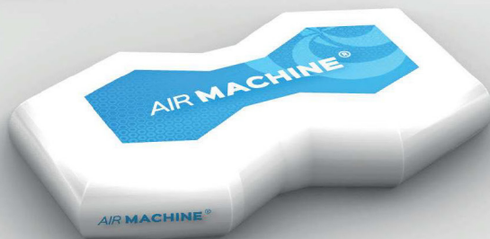
Seat 160x100 cm