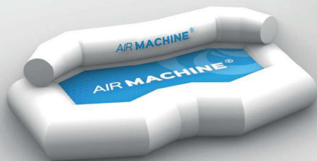
Sofa 2-zit: 160x100 cm