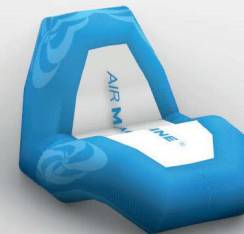
Zetel: 100x110 cm