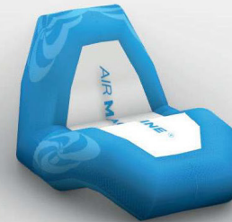
Fauteuil: 100x110 cm