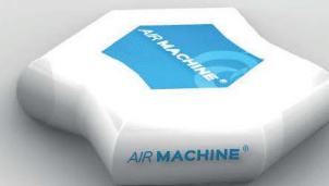
Pouf: diamètre 85 cm